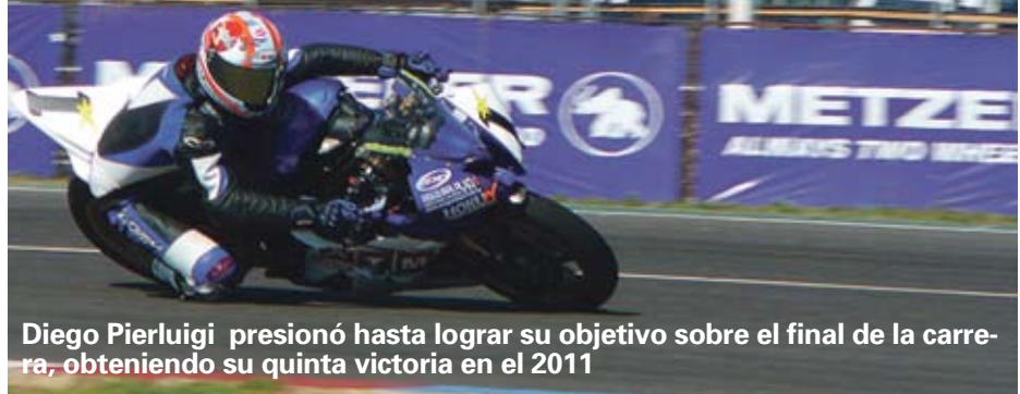
Diego Pierluigi presionó hasta lograr su objetivo sobre el final de la carrera, obteniendo su quinta victoria en el 2011

Nota Gustavo Crespo