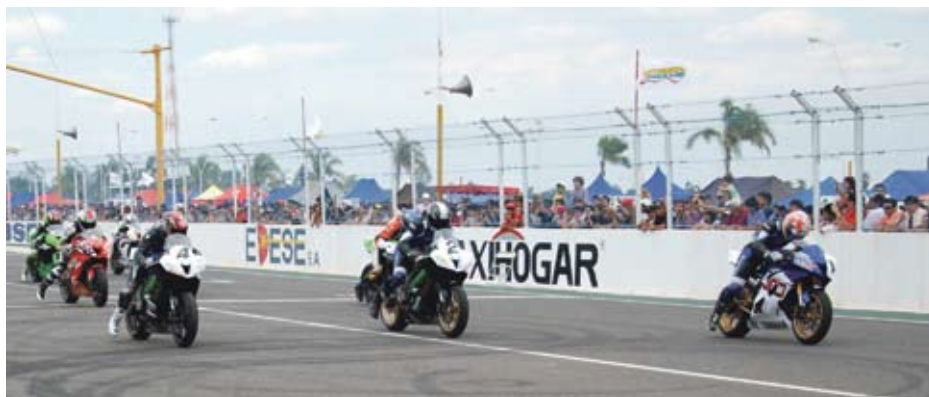
Se disputó ante 8.000 espectadores + info y fotos en www.AJEMOV.com.ar

Con el relanzamiento el piloto de San Francisco volvió a imponer su ritmo. Detrás, los duelos en todos los sec-